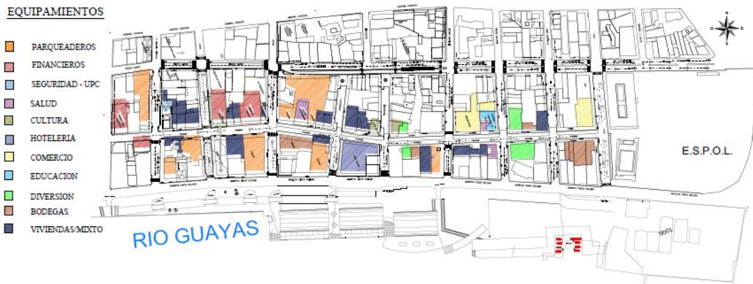
Imagen 2. Mapeo calle Panamá y su influencia-